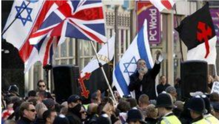
Manifestación de la Liga de Defensa Inglesa (EDL) en contra del islam y en apoyo a Israel, afuera de la embajada de Israel en Londres

En Holanda , el líder del partido islamófobo Geert Wilders, afirmó que Israel es "la primera línea de defensa de Occidente" contra el islam. Según sus propias palabras, ha visitado Israel más de 40 veces.