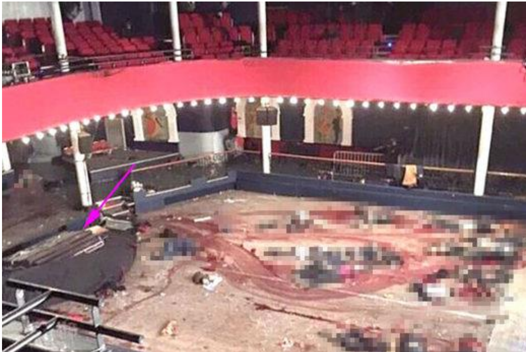
Supuesta foto de Bataclán justo después del ataque

Pero la prueba más sorprendente se relaciona con la siguiente fotografía. Es la única imagen "filtrada" del baño de sangre en Bataclán: