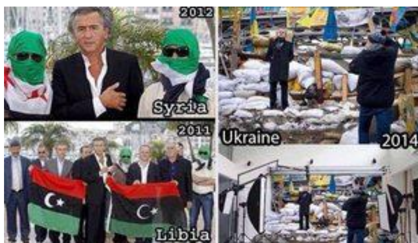
Bernard Henri Levy y tipos como él escenifican el caos falso para crear el caos verdadero.

La ideología neoconservadora se resume en el Proyecto para un Nuevo Siglo Americano que se basa en un memorando de 1996 encargado por Benjamin Netanyahu para desarrollar una estrategia en Medio Oriente al servicio de los intereses israelíes.