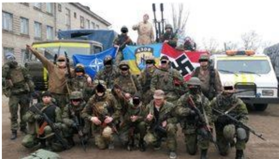
Miembros del batallón neonazi Azov, financiado por Israel

Pero quizás el mejor ejemplo de una alianza entre Israel y los movimientos de extrema derecha está en Ucrania, donde Israel decidió armar al batallón Azov, una organización paramilitar neonazi.