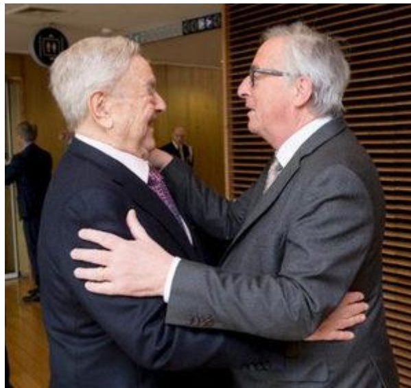
George Soros y el presidente de la UE, Jean Claude Juncker

Numerosas y poderosas organizaciones controladas por Soros están directamente involucradas en: