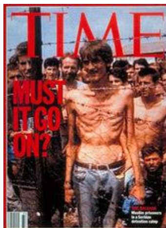
Campo de exterminio falso en Bosnia - Portada de Time

La destrucción de Libia por la OTAN no fue el primer intento exitoso de BHL de desencadenar una guerra. Pocos años antes desempeñó un papel central en el inicio de una guerra contra Serbia (1992-1995) demonizando a los serbios y difundiendo noticias falsas sobre la persecución de los bosnios y de fosas comunes , que no existieron en realidad, y el uso de armas químicas .