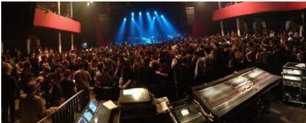
El despliegue real de la mesa de mezclas durante el concierto

La mesa de mezclas usada por Eagles of Death Metal es una Midas Verona 48. Es mucho más grande que la mesa de mezcla en la foto del baño de sangre. Además, los enormes accesorios alrededor de la mesa de mezclas han desaparecido.