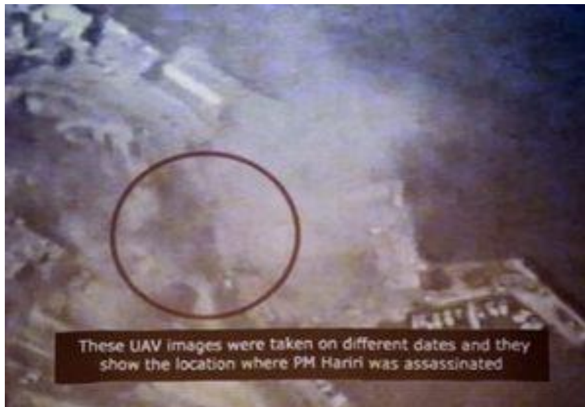
Drones israelíes vigilaron los movimientos de Hariri y la escena del crimen.

En Europa, el poder desestabilizador de ISIS estaría contenido, si se limitara a establecer un Califato en el Medio Oriente. Pero la mayoría de los ataques terroristas ocurridos en Europa en los últimos años han sido atribuidos a ISIS. Esos ataques tienen una fuerte influencia en la opinión europea, en particular en el sentimiento negativo de la gente sobre la inseguridad y la inmigración.