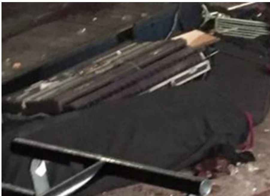
Primer plano de la mesa de mezcla de sonido

En la imagen de arriba (flecha púrpura) se puede ver la mesa de mezclas que supuestamente fue utilizada por el ingeniero de sonido de la banda Eagles of Death Metal . Aquí hay un primer plano: