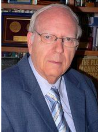
Efraim Halevy, director del Mossad de 1998 a 2002

Los muyahidines se transformaron en Al Qaeda (dirigida entonces por el saudí Osama Bin Laden), que finalmente se convirtió en ISIS tras la destrucción de Irak. Los muyahidines, Al Qaeda e ISIS fueron supervisados y apoyados por la CIA. Es igual hoy en día.